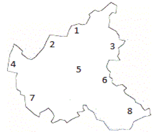
Große Stadtkarte der Hammerburg u.a. beim Wirt erhältlich